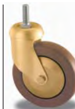
RUOTA GIREVOLE SWIVEL CASTOR

Brown rubber tyre non-marking, injected on polypropylene centre. Wheel on water proof original ball bearing DIN 625. Resistant to fluids, delayed combustion, atmospherically agent-proof, suitable for almost all application. Hardness Sh/A 90. Pressed steel housing swivel on double ball races. Brass finishing.