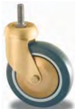
RUOTA GIREVOLE SWIVEL CASTOR