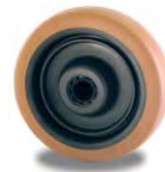
RUOTA SU RULLI WHEEL ON ROLLER BEARING

- MEDIOCRE • RATHER GOOD -- PESSIMO • VERY BAD