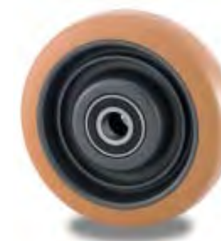
RUOTA SU CUSCINETTI WHEEL ON ORIGINAL BALL BEARINGS