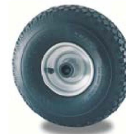
CORPO A DISCHI IN ACCIAIO ZINCATO WHEEL CENTRE IN PRESSED STEEL