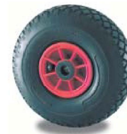
CORPO IN POLIPROPILENE WHEEL CENTRE IN POLYPROPYLENE

- MEDIOCRE - RATHER GOOD - PESSIMO - VERY BAD