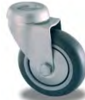
RUOTA GIREVOLE SWIVEL CASTOR