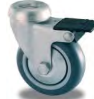
FRENO RUOTA WHEEL BRAKE