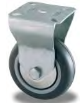
RUOTA FISSA FIXED CASTOR