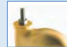
ATTACCO FILETTATO THREADED STEM