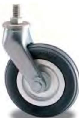
RUOTA GIREVOLE SWIVEL CASTOR

Grey rubber tyre non-marking on plain bearing. Aluminium housing swivel on double ball races. Chrome finishing.