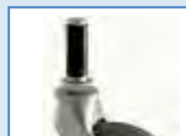
ESPANSORE IN NYLON POLYAMIDE EXPANDER