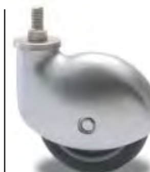
RUOTA GIREVOLE FINITURA CROMATA SWIVEL CASTOR CHROME FINISHING