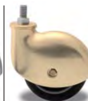
RUOTA GIREVOLE FINITURA OTTONATA SWIVEL CASTOR BRASS FINISHING