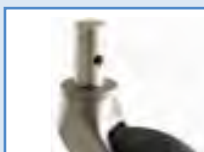
ATTACCO CILINDRICO STEEL STEM