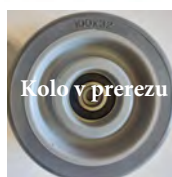
Kolo v prerezu