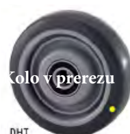
Kolo v prerezu